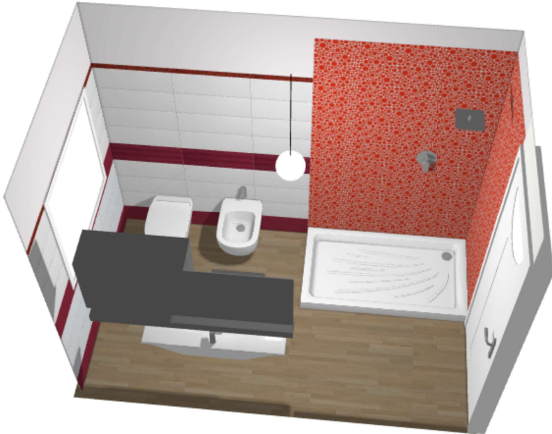
Bagno tipo 2