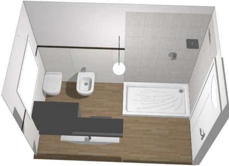
Bagno tipo 1