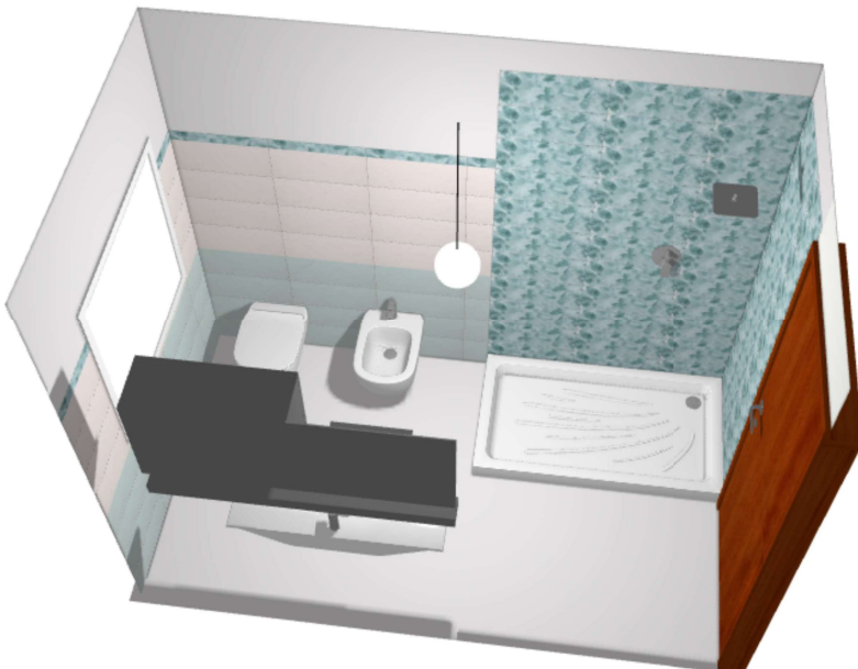
Bagno tipo 3